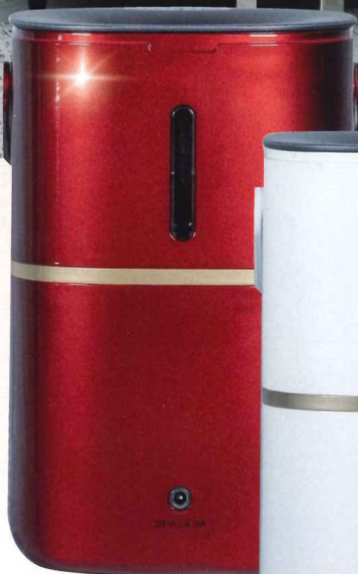
スイリーブ SS-120レッド