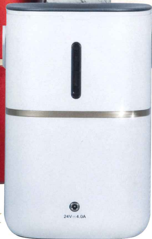
スイリーブ SS-120ホワイト